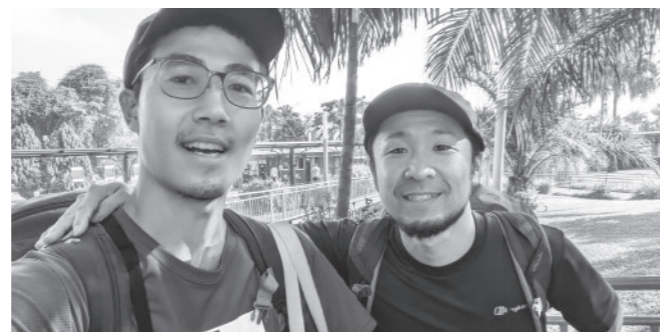
ジョニーがルワンダからボツワナに帰る時、五城目での再会を約束しました。

五城目町でお世話になった期間を含めると、2年間以上の応援、本当にありがとうございました。またお会いできるのを楽しみにしています。