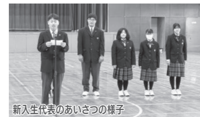
新入生代表のあいさつの様子