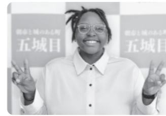
アメリカ合衆国ワシントン州出身。2024年7月29日から、町の外国語指導助手(ALT)に着任しました。