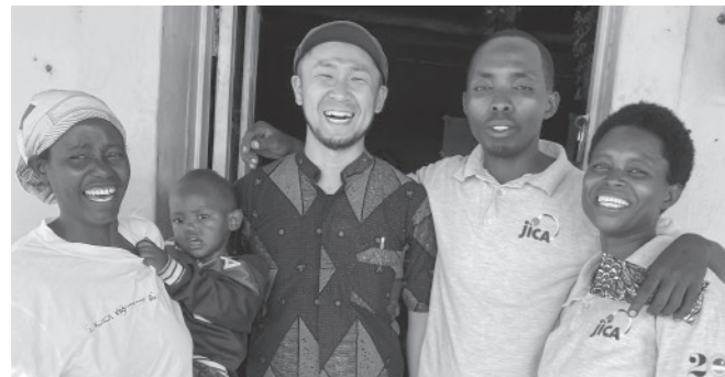
活動先メンバーと再会を約束し、笑顔でお別れしました。

この2年間は、現地の方々とともに考え、行動し、少しずつ形にしていくことができた、かけがえのない時間になりました。生活や活動を通して、人とのつながりの大切さや、支え合うことの意味を改めて実感しました。五城目町とルワンダでの経験を活かしなが、これからも自分にできることを続けていきたいと思ひます。これまで温かく見守っていただき、本当にありがとうございました!