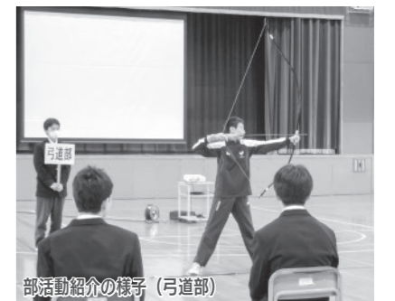
部活動紹介の様子(弓道部)

対面式では、五高のあいさつである「立ち止まってるあいさつ」を覚えていただきました。また、2・3年生のような「楽しむときは楽しみ、授業などはまじめに取り組む」そんな五高生になりたいと思ひました。