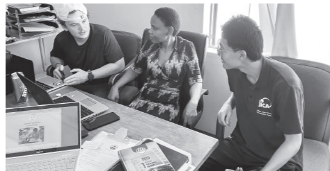
同僚たちと一緒に過ごした懐かしい日々

住民の生活の向上を図るため、お土産商品づくり、イベント・ワークショップの実施、学校での授業など、様々な事に挑戦した2年間でした。うまくいった事もあれば、そうでない事もたくさんあり、自分自身も成長を感じられました。同僚との別れは寂しいものでしたが、お互い異なる場所で頑張ろうと伝えたので、ボツワナと日本と、遠く離れてはいますが心は繋がっています。日本に帰ってからも自分なりに頑張っていきます! 2年間応援ありがとうございました。