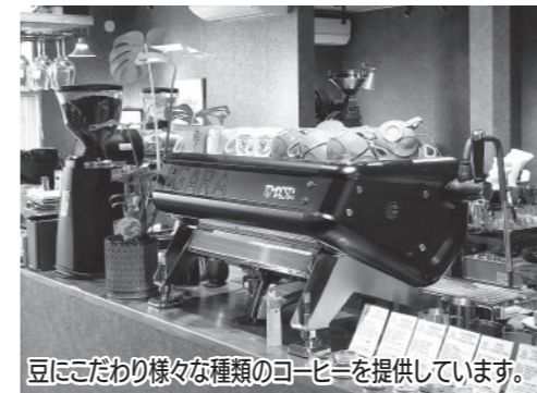
豆にこだわり様々な種類のコーヒーを提供しています。