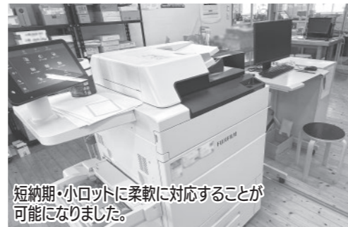
短納期・小ロットに柔軟に対応することが可能になりました。