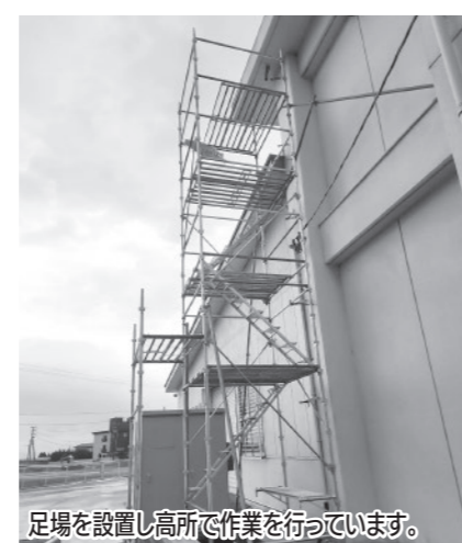
足場を設置し高所で作業を行っています。