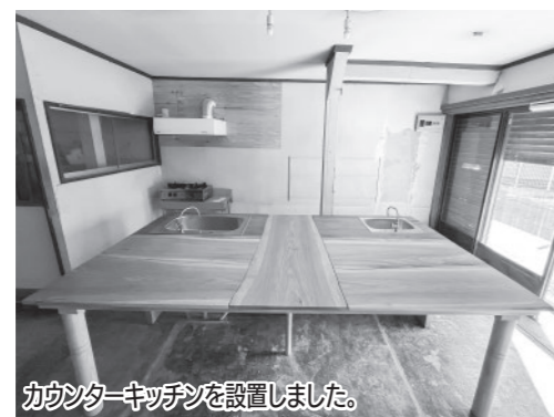
カウンターキッチンを設置しました。

地元の材料を使った食品の加工・製造を行うため、開発や生産力向上に向けた環境を整備しました。