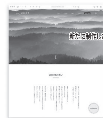
新たに制作したホームページです。