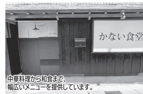
中華料理から和食まで、幅広いメニューを提供しています。