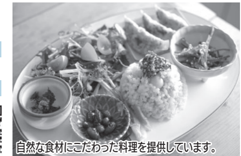
自然な食材にこだわった料理を提供しています。