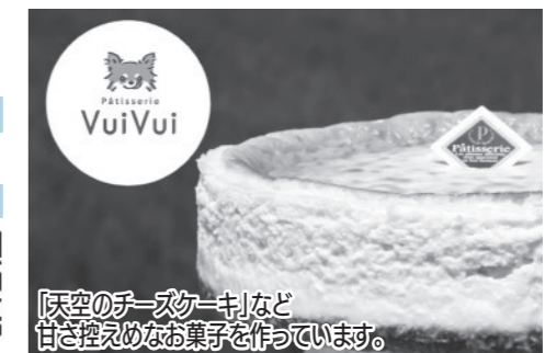
「天空のチーズケーキ」など 甘さ控えめなお菓子を作っています。