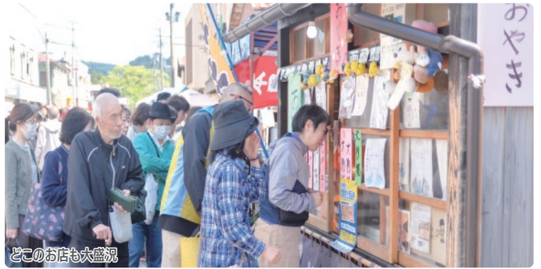
どこのお店も大盛況