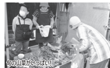
旬の山菜がいっぱい!

春の味覚が勢ぞろい! 朝市うきうき春まつり! 5月10日、「朝市うきうき春まつり」が朝市pm+とあわせて開催されました。 当日は、各出店者がアイコやウドといった新鮮な山菜を販売したほか、「だまご鍋コーナー」「山菜汁コーナー」などが設置され、会場は多くの来場者でにぎわいました。