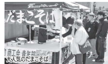
大人気のだまごそば