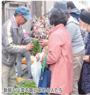
新鮮な山菜を買い求める人たち