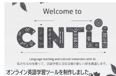
私たちはAIを使って、言語学習と文化交流の新しい形を創造します。 オンライン英語学習ツールを制作しました。