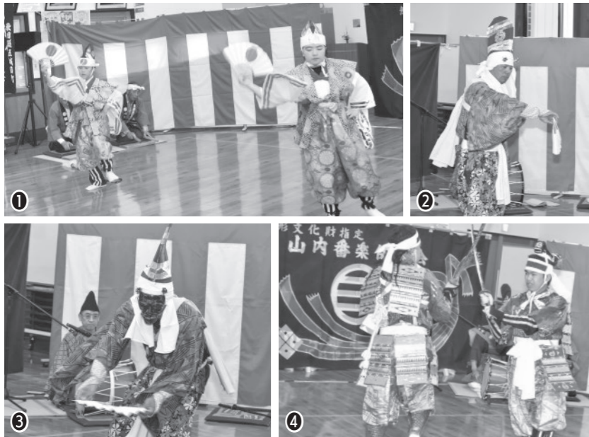
①番楽の初めに披露され全てを清める意味が込められている「露払」(こども番楽教室) ②舞台をはらい清めるために舞う「清祓」(黒川番楽保存会) ③祝福を表現した舞「三番叟」(黒川番楽保存会) ④曾我十郎・五郎兄弟の奮闘の様子を演じる「曾我兄弟」(山内番楽保存会・こども番楽教室)

5月16日、五城目朝市ふれあい館で番楽競演会を開催しました。 番楽は、山にこもり修行をする「山伏」の集団によって伝えられた宗教的な舞踊「神楽」を起源とする伝統芸能です。中世から江戸時代初期にかけて広く普及し、五城目町の番楽にもこの頃に定着したとされています。 当日は、町内の「山内番楽保存会」「こども番楽教室」、秋田市の「黒川番楽保存会」の皆さんが出演。「露払」「清祓」「三番叟」「曾我兄弟」が披露され、会場は多くの来場者でにぎわいました。