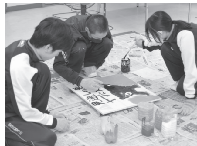
看板制作に取り組む生徒たち