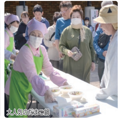
大人気のだまご鍋