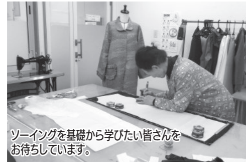
ソーイングを基礎から学びたい皆さんをお待ちしています。