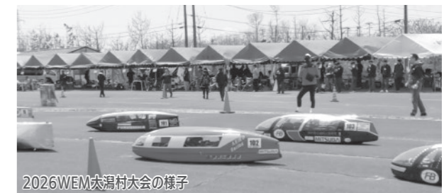
2026WEM大潟村大会の様子