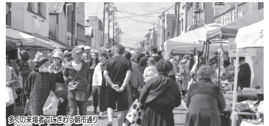
多くの来場者でにぎわう朝市通り