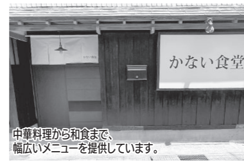
中華料理から和食まで、幅広いメニューを提供しています。