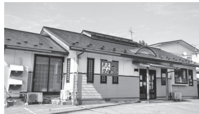
客席のエアコンを更新

補助金の使い道 経年劣化により傷んだ朝市販売所の屋根を改修し、安全な環境を整備しました。