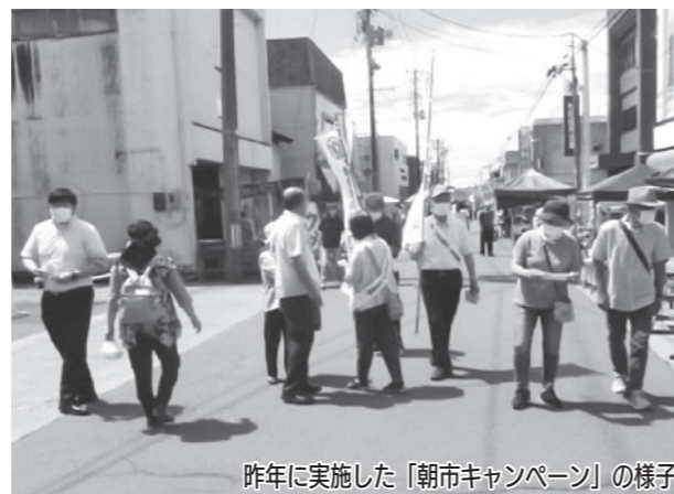
昨年に実施した「朝市キャンペーン」の様子