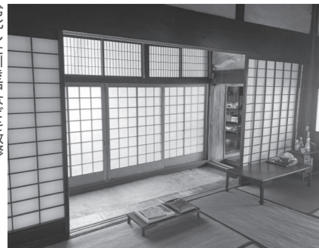
劣化した引き戸などを改修

補助金の使い道 劣化が進んでいる台所・浴室の蛇口、引き戸を改修し、快適な宿泊環境を整備しました。