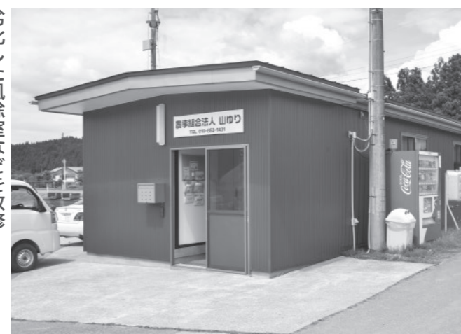
劣化した風除室などを改修