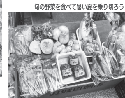
旬の野菜を食べて暑い夏を乗り切ろう!