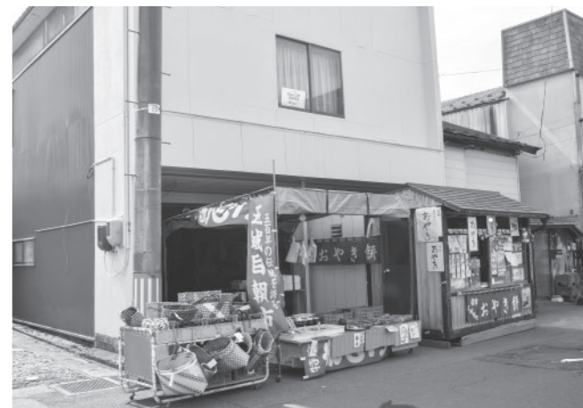
販売所の屋根を修繕