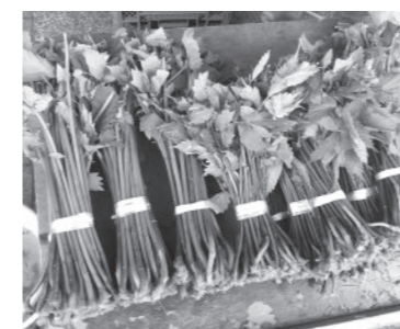
ご飯のお供にミズたきはいかが?

7月はミズなどの山菜のほか、夏野菜も少しずつ出始めます。おいしい夏の味覚をぜひお楽しみください!