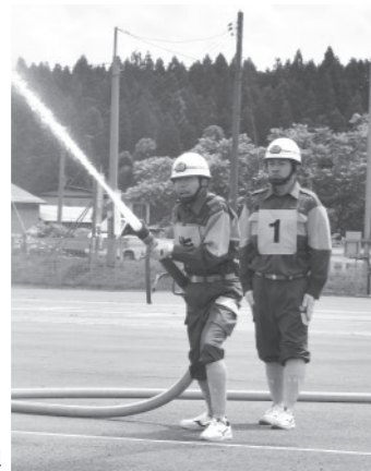
訓練の成果を発揮し、力強く放水する団員

本大会では、消火活動の速さや正確さを競う「小型ポンプ操法の部」に5つの分団が参加。第10・11分団が優勝を果たし、「男鹿潟上南秋支部消防訓練大会」への出場を決めました。