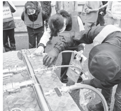
五城目高等学校での応急給水訓練

5月25日、「第9回五城目町総合防災訓練」を実施しました。 今回の訓練では、大雨による土砂・洪水災害の発生に加え、大きな地震の発生も想定しました。訓練会場となった旧大川小学校体育館・五城目高等学校などでは、パーティションや避難ベッドの設置など、避難所の開設・運営方法を確認しました。 また、五城目警察署署員の誘導訓練や、町社会福祉協議会での災害ボランティアセンターの開設訓練、町ボランティア連絡協議会による炊き出し訓練、初めてとなる湖東老健・ショートステイおもてなし両施設間での、福祉避難所開設運営訓練、配慮が必要な方の避難訓練、各避難所での応急給水訓練なども実施しました。 町では、訓練などを通じて課題や反省点を洗い出し、災害に強いまちづくりを進めていきます。