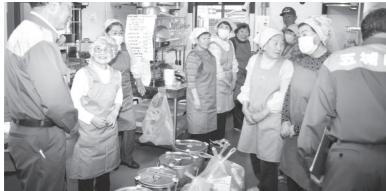
町ボランティア連絡協議会による炊き出し訓練

5月25日、「第9回五城目町総合防災訓練」を実施しました。 今回の訓練では、大雨による土砂・洪水災害の発生に加え、大きな地震の発生も想定しました。訓練会場となった旧大川小学校体育館・五城目高等学校などでは、パーティションや避難ベッドの設置など、避難所の開設・運営方法を確認しました。 また、五城目警察署署員の誘導訓練や、町社会福祉協議会での災害ボランティアセンターの開設訓練、町ボランティア連絡協議会による炊き出し訓練、初めてとなる湖東老健・ショートステイおもてなし両施設間での、福祉避難所開設運営訓練、配慮が必要な方の避難訓練、各避難所での応急給水訓練なども実施しました。 町では、訓練などを通じて課題や反省点を洗い出し、災害に強いまちづくりを進めていきます。