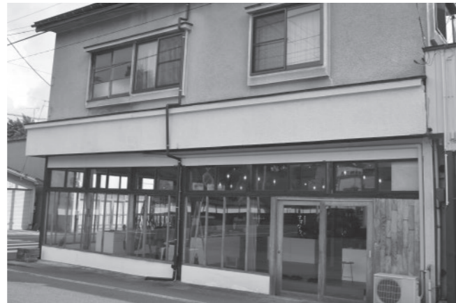
雨どいと雪止めを改修

補助金の使い道 雨どいの改修と雨どいの破損原因でもある雪止めの改修を行いました。