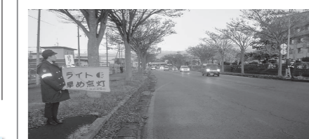
「4時からライト」キャンペーンの様子。