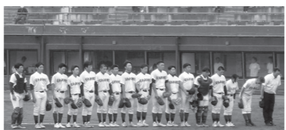
能代球場で行われた甲子園予選。全校応援のもと、選手たちは全力で試合に臨みました。