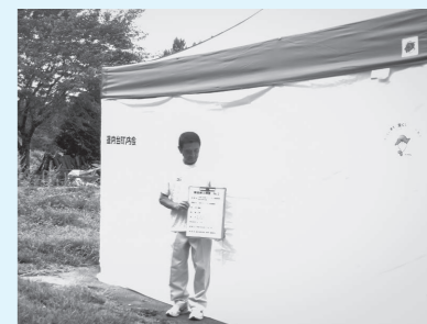
▶ 蓬内台町内会 (一般コミュニティ助成事業) コミュニティ活動に使用するテント、エアコンなどを整備しました。