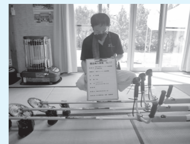
▶ 広ヶ野町内会 (一般コミュニティ助成事業) コミュニティ活動に使用するテント、草刈機などを整備しました。

宝くじの社会貢献広報事業として行われているコミュニティ助成事業の助成金により、本年度は2団体が活動用備品を整備しました。