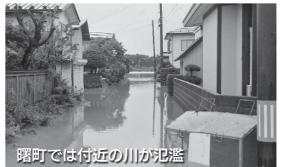
曙町では付近の川が氾濫