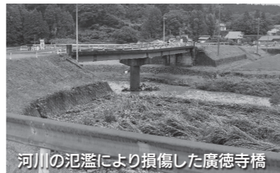
河川の氾濫により損傷した廣徳寺橋