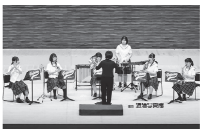
あきた芸術劇場ミルハスで行われた吹奏楽コンクール中央地区大会。見事金賞を受賞しました。