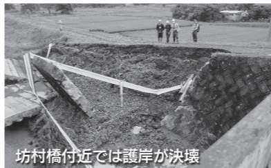
坊村橋付近では護岸が決壊