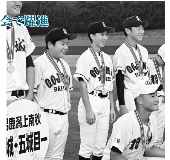
大曲中学校との試合後、羽城中学校の選手と並び記念撮影をする五城目第一中学校の3人。

8月5日に開幕した「第52回東北中学校野球大会」では、宮城県代表の山元との初戦に3対0で勝利。翌日に行われた、青森代表の板柳との試合では、1対0で惜敗し全国大会出場を逃しましたが、11人という少ない部員ながら東北8強入りを果たしました。