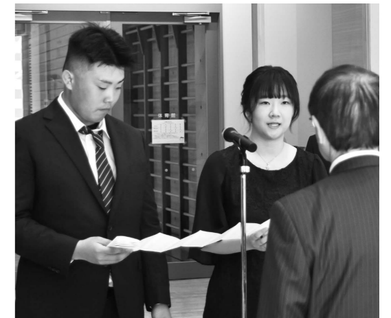
渡邊町長を前に、誓いのことばを述べる□□さん(左)と□□さん(右)。

最後に、出席者を代表して、□□□□さんと□□□□さんが「無事この日を迎えられたのも、地域の皆さまや、これまで育ててくれた家族のおかげと心から感謝しております。一つ一つの発言や行動に責任をもち、ひとりの大人として、生まれ育った五城目町や社会に貢献できるよう精進したい」と、誓いの言葉を述べました。