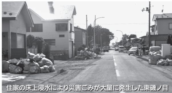
住家の床上浸水により災害ごみが大量に発生した東磯ノ目