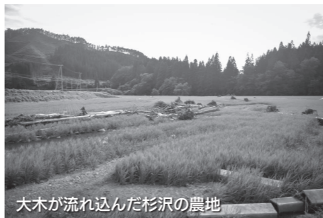
大木が流れ込んだ杉沢の農地