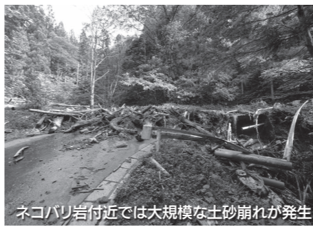
ネコバリ岩付近では大規模な土砂崩れが発生